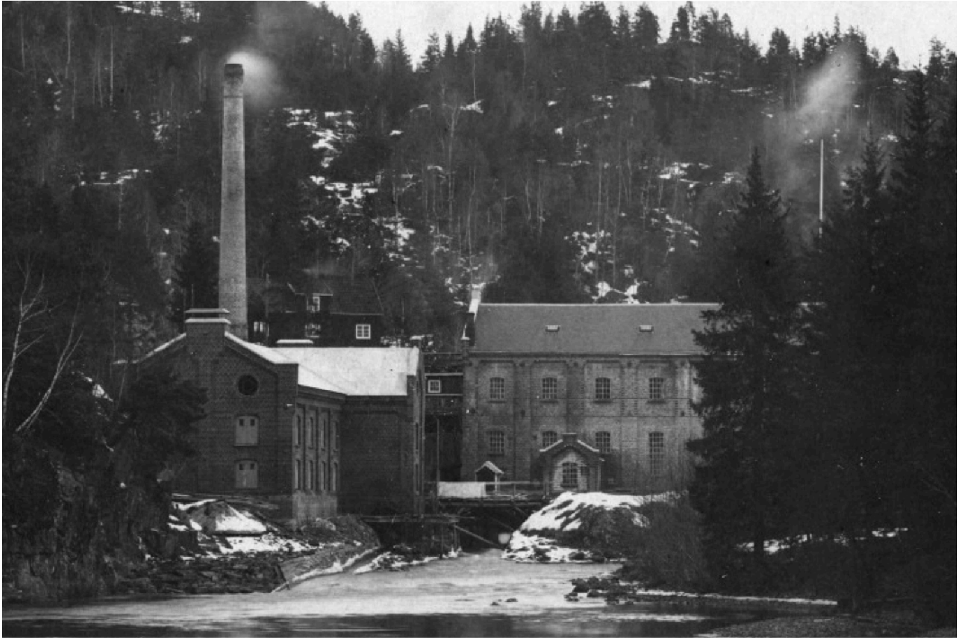
Stifoss tresliperi - Foto tatt i 1911. Til venstre ser man «Tørkeriet» og til høyre ser man «Sliperiet», og i bakgrunnen «Administratørboligen». Siden den gang har også «Kraftstasjonen» kommet til i forgrunnen, til venstre for «Tørkeriet».